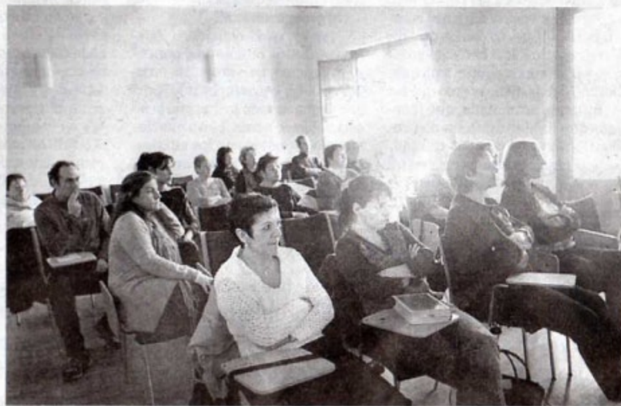
La UPL celebró debates, cuentacuentos y proyectó varias cintas.