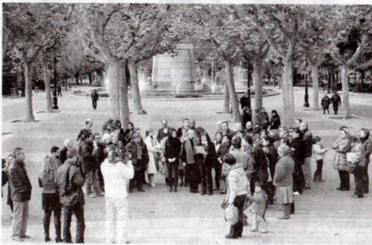
La Plataforma 8 de Marzo se concentró en El Espolón y entregó pulseras.

A mediodía, medio centenar de personas, que se iban sumando a su paso por la céntrica plaza, se concentraron a petición de la Plataforma 8 de Marzo, que repartió pulseras y leyó un manifiesto. «La desigualdad que pervive todavía en nuestra sociedad entre hombres y mujeres es la causa de que todavía miles de mujeres en el mundo sufran ataques contra su integridad física y psíquica, que constituyen una importante violación de los derechos humanos», decía el manifiesto. Y es que cualquier acto se queda corto para recordar a las víctimas de la violencia.