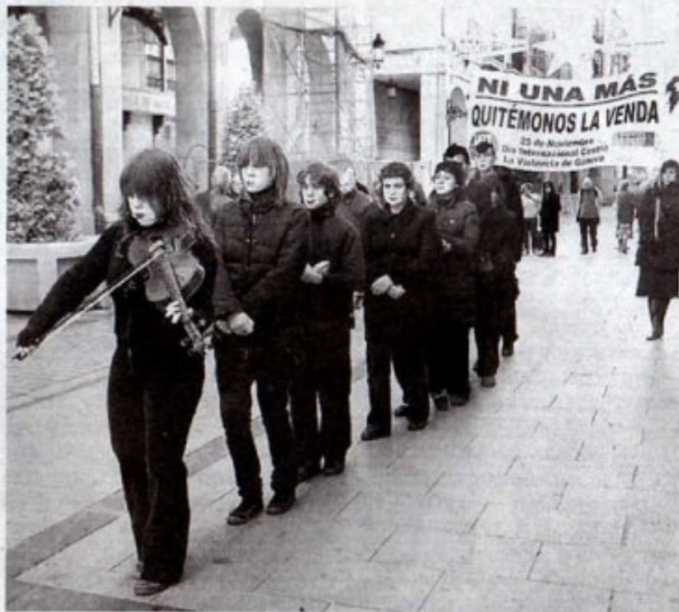
UGT trasladó sus actos a la calle con varios números de teatro.

Esta es la situación que atraviesan muchas 'pilares' en el mundo. Algunas sobreviven y rehacen su vida, otras vuelven con sus maridos rehabilitados, pero un gran número muere a manos de su pareja, aquellas que creían que cambiaría. Y este es también el argumento central de la película 'Te doy mis ojos' de la que ayer la Universidad Popular de La Rioja proyectó una parte. El motivo: el Día Internacional contra la Violencia hacia las Mujeres, bajo el lema 'Ni una más. Quitémonos la venda'. Durante toda la mañana, la UPL abrió sus puertas al público para invitar a la reflexión sobre